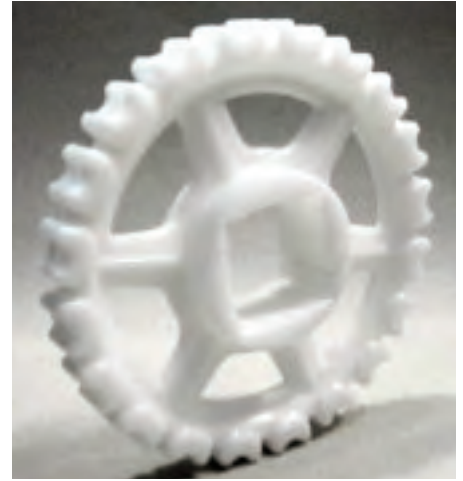
Pignon 20 dents