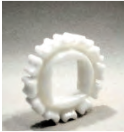
Pignon 12 dents