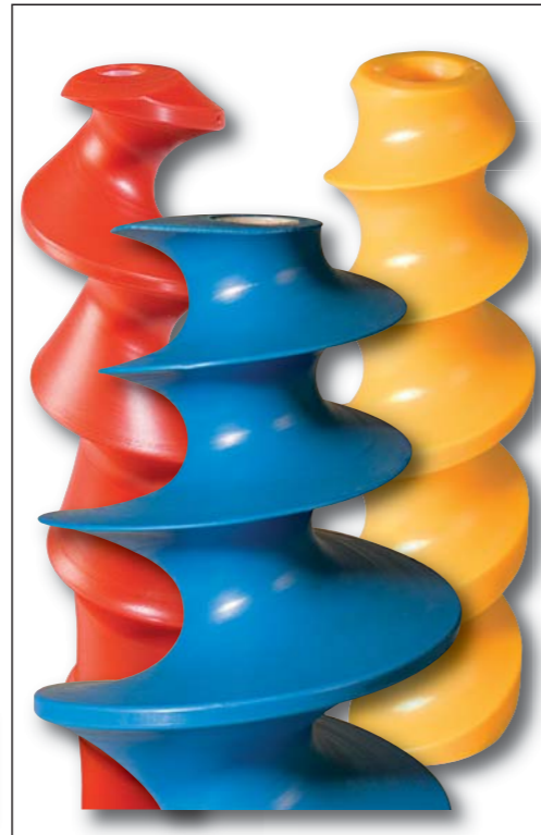
Manchons de retournement. De 90° à 360°.

Vis, systèmes de vis Relevés, conception, fabrication, tests, assistance au démarrage.