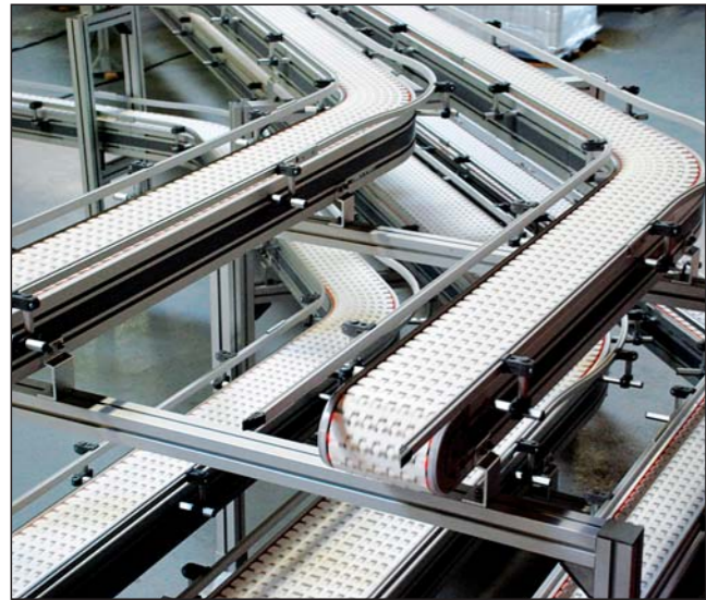
Profils de glissement et guides chaînes.

Convoyeurs modulaires aluminium, FlexMove® et FlexToo® de 45 à 1000 mm de large.